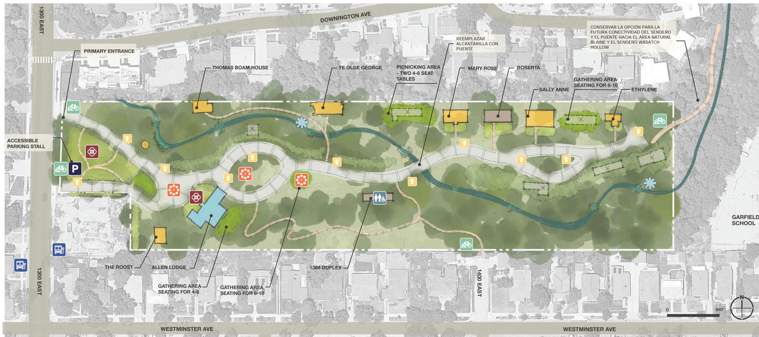
Figura Ex - Mapa conceptual de reutilización adaptativa